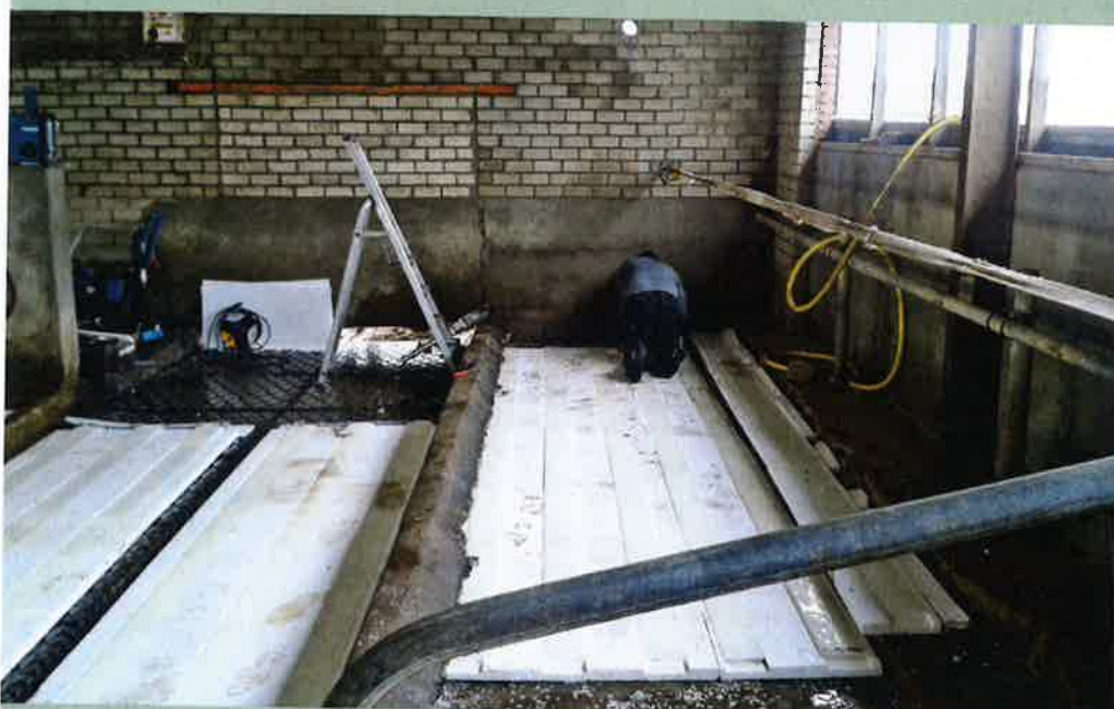
Lamellen in de mestgang en onder de ligplaats koelen de mest en de koe

Naast het koelen van de lucht in de melkveestal kan ook het koelen van het betonoppervlak een bijdrage leveren aan het verminderen van hittestress bij koeien. Onderzoek daarnaar, mede gefinancierd uit de SBIR-regeling van RVO, werd uitgewerkt om het effect van koeling op emissie van stoffen als ammoniak en methaan te onderzoeken. Lamellen met koelvloeistof – in dit geval water – onder het betonoppervlak koelen de mestgang, de ligboxen en de voergang. Harm Wientjes, projectleider bij DLV Advies, vertelt: 'Door de mestgang te koelen, blijft mest en urine koeler, waardoor er minder emissie plaatsvindt. Daarnaast komt de mest koeler in de opslag en dat zou de emissie van verschillende stoffen verlagen. Uit de eerste proefopstelling blijkt dat onder warme omstandigheden de ammoniakemissie met 76 procent daalt en de me-