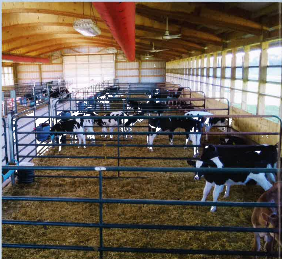
Buisventilatie levert frisse lucht op lage snelheid af bij het kalf, op 1,20 meter hoogte

'Een kalf moet de mogelijkheid hebben zichzelf "in te nestelen" in het stro, dat is de eerste voorwaarde bij een goede jongveeopfok', begint Vreeburg zijn aanbevelingen voor jongveeopfok. 'Dan het stalklimaat, de luchtkwaliteit in de stallen: ventileer als ware het een varkensstal, maar bedenk dat een kalf tot vijf keer meer frisse lucht nodig heeft dan een varken van hetzelfde gewicht', vervolgt hij.