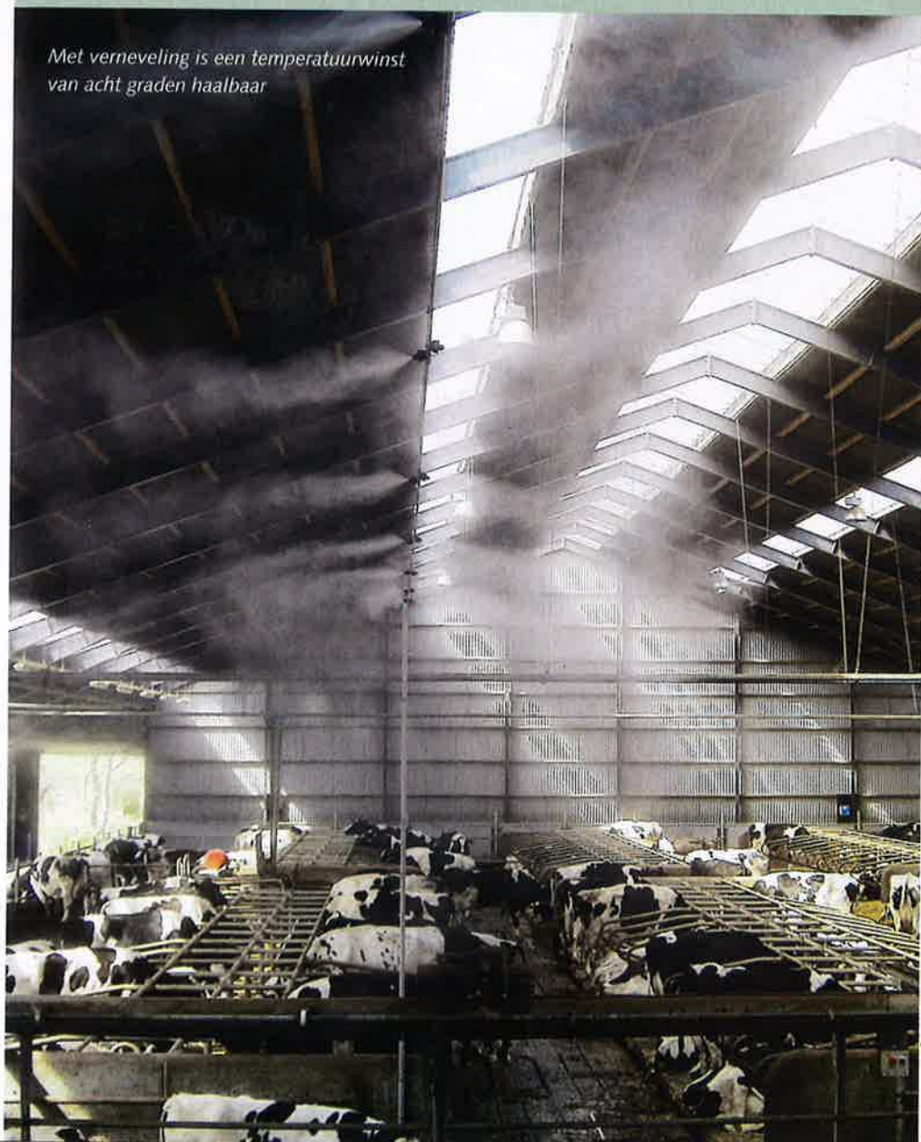
Met verneveling is een temperatuurwinst van acht graden haalbaar

De optimale positie van het mistsysteem is afhankelijk van het type en de lay-out van de stal. Bij verticale ventilatoren wordt het mistsysteem boven de mestgangen tussen de boxen of tussen het voerhek en de boxen opgehangen. Bij een stal waar al horizontale ventilatoren aanwezig zijn, worden verstuivers met een leiding boven het voerhek gemonteerd.